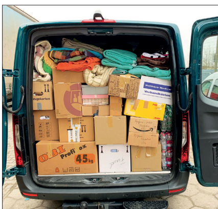
Il furgone ha portato al confine ucraino numerose donazioni in natura, tra cui due generatori di energia elettrica di cui c'era urgente bisogno

A Giessen, Vereinigte Hagelversicherung ha offerto un aiuto concreto mettendo a disposizione dei rifugiati un appartamento della