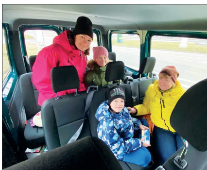
In piena sicurezza diversi rifugiati sono stati riportati in Germania durante il tragitto

a Chelm, nella Polonia orientale. Successivamente, la squadra di soccorso si è diretta verso il valico di frontiera di Hrebennie e ha portato con sé diversi rifugiati sino a Giessen in Germania.